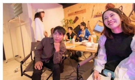
↑慶應義塾大学のインフルエンサーにむけて開催した「ほりつ寺子屋」の様子